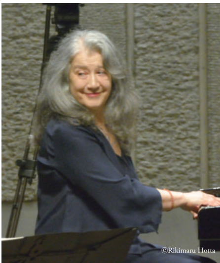
マルタ・アルゲリッチ | ピアノ |

アルゼンチンのブエノス・アイレス生まれ。名実ともに世界の頂点に立つピアニストとしてその活動は常に世界中の音楽ファンから注目されている。神童として早くから注目を浴び、ヨーロッパに渡り 1957 年ブゾニ国際ピアノ・コンクールおよびジュネーヴ国際ピアノ・コンクールで優勝。1965 年ショパン国際コンクール優勝以来今日まで世界中の著名なオーケストラや指揮者、音楽祭から絶えず招きを受けている。1994 年から別府ビーコンプラザ・フィルハーモニアホール名誉音楽監督に就任。1998 年より「別府アルゲリッチ音楽祭」総監督を務め、アジアをはじめ世界の音楽家との共演を行っているほか、若手音楽家の育成にも力を注ぎ、自らマスタークラスで指導にあたるなど、その革新的な音楽創造への試みは日本をはじめ世界の音楽界に多大な影響を与え続けている。常に人気投票 1 位を誇り、産経新聞での音楽評論家、ジャーナリストによる投票では群を抜いて 1 位に輝いている。ヨーロッパでの数々の叙勲をはじめ日本においても 2005 年、(財)日本美術協会主催の「第 17 回高松宮殿下記念世界文化賞」音楽部門受賞、また、同年、別府アルゲリッチ音楽祭の功績を評価され、日本国政府より「旭日小綬章」受章。2016 年、初来日から 46 年間の音楽活動はもとより当財団の活動でもある音楽文化の発展及び友好親善に寄与した功績が認められ日本国政府より旭日中綬章を受章。また芸能分野でアメリカの芸術文化に大きな功績を残した人に贈られるケネディ・センター名誉賞を受賞。2007 年 3 月、財団法人アルゲリッチ芸術振興財団総裁に、2013 年 9 月、公益財団法人アルゲリッチ芸術振興財団総裁に就任。