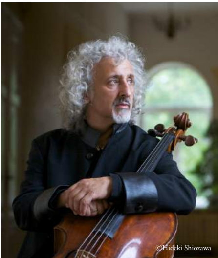
ミッシェ・マイスキー | チェロ |

アルゼンチンのブエノス・アイレス生まれ。名実ともに世界の頂点に立つピアニストとしてその活動は常に世界中の音楽ファンから注目されている。神童として早くから注目を浴び、ヨーロッパに渡り 1957 年ブゾニ国際ピアノ・コンクールおよびジュネーヴ国際ピアノ・コンクールで優勝。1965 年ショパン国際コンクール優勝以来今日まで世界中の著名なオーケストラや指揮者、音楽祭から絶えず招きを受けている。1994 年から別府ビーコンプラザ・フィルハーモニアホール名誉音楽監督に就任。1998 年より「別府アルゲリッチ音楽祭」総監督を務め、アジアをはじめ世界の音楽家との共演を行っているほか、若手音楽家の育成にも力を注ぎ、自らマスタークラスで指導にあたるなど、その革新的な音楽創造への試みは日本をはじめ世界の音楽界に多大な影響を与え続けている。常に人気投票 1 位を誇り、産経新聞での音楽評論家、ジャーナリストによる投票では群を抜いて 1 位に輝いている。ヨーロッパでの数々の叙勲をはじめ日本においても 2005 年、(財)日本美術協会主催の「第 17 回高松宮殿下記念世界文化賞」音楽部門受賞、また、同年、別府アルゲリッチ音楽祭の功績を評価され、日本国政府より「旭日小綬章」受章。2016 年、初来日から 46 年間の音楽活動はもとより当財団の活動でもある音楽文化の発展及び友好親善に寄与した功績が認められ日本国政府より旭日中綬章を受章。また芸能分野でアメリカの芸術文化に大きな功績を残した人に贈られるケネディ・センター名誉賞を受賞。2007 年 3 月、財団法人アルゲリッチ芸術振興財団総裁に、2013 年 9 月、公益財団法人アルゲリッチ芸術振興財団総裁に就任。