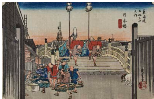
保永堂版 東海道五十三次之内 日本橋 朝之景 江戸時代 天保4～5年(1833～34)