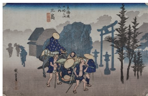
保永堂版 東海道五十三次之内 三島 朝霧 江戸時代 天保4～5年(1833～34)