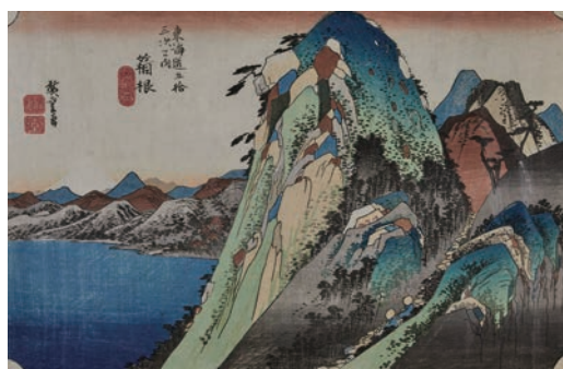
保永堂版 東海道五十三次之内 箱根 湖水図 江戸時代 天保4～5年(1833～34)