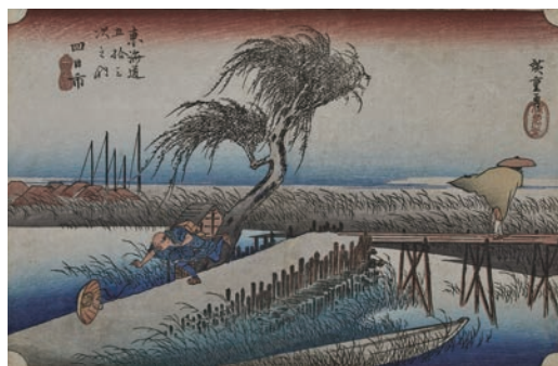
保永堂版 東海道五十三次之内 四日市 三重川 江戸時代 天保4～5年(1833～34)