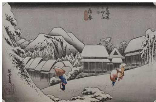
保永堂版 東海道五十三次之内 蒲原 夜之雪 江戸時代 天保4～5年(1833～34)