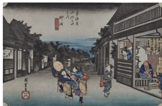
保永堂版 東海道五十三次之内 御油 旅人留女 江戸時代 天保4～5年(1833～34)