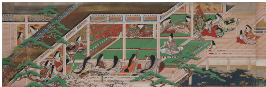
浄瑠璃物語絵巻 第3巻（部分）

本展での公開総延長は 60 メートルを超え、この絵巻の魅力を充分にご堪能いただけます。